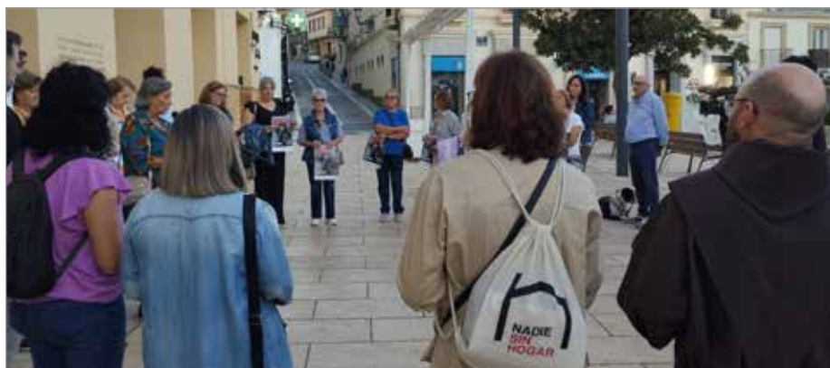
📷 Celebración del acto de calle por las personas sin hogar en Vélez Málaga

Tras los actos desarrollados en la capital, Cáritas también ha llevado la campaña a distintos puntos de la provincia como Fuengirola, Vélez Málaga y Torre del Mar, donde parroquias, voluntarios y asociaciones se han unido para visibilizar el sinhogarismo participando en espacios públicos y programas de radio y televisión.