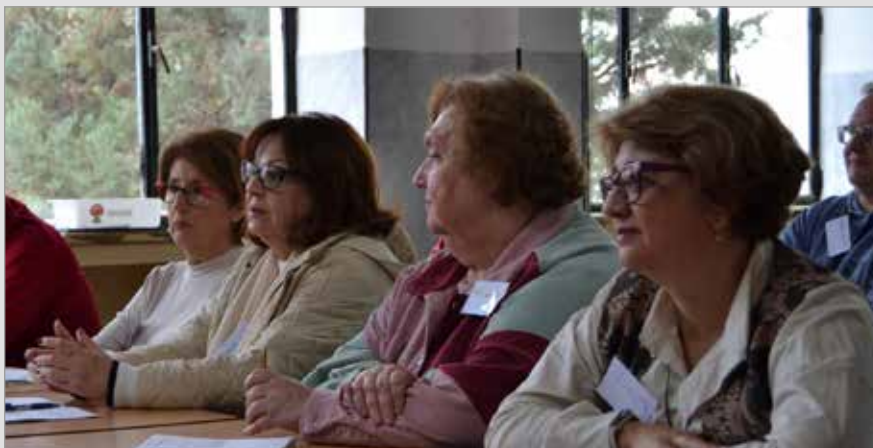
📷 Los asistentes pudieron elegir entre catorce talleres con distintas temáticas

de Málaga, Mons. José Antonio Satué, que animó a seguir siendo testigos de esperanza en medio de las vulnerabilidades del mundo.