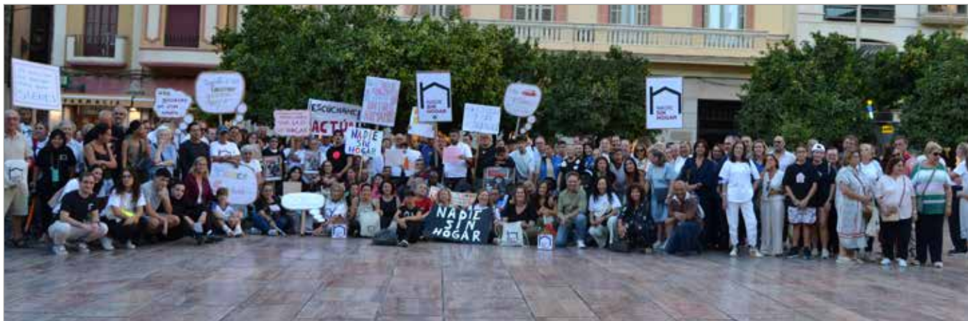
📷 Entidades de la Agrupación de Desarrollo para personas sin hogar participaron en el acto de calle celebrado en la capital

Cáritas Málaga se ha sumado, como cada año, a la Campaña Confederal Nadie Sin Hogar 2025, bajo el lema “Sin hogar, pero con sueños” . Esta iniciativa busca visibilizar la realidad de las personas en situación de sin hogar, interpelar a la sociedad y a las administraciones, y reivindicar el cumplimiento de sus derechos fundamentales. Porque no tener un hogar no significa no tener sueños, ni dejar de ser parte de la comunidad.