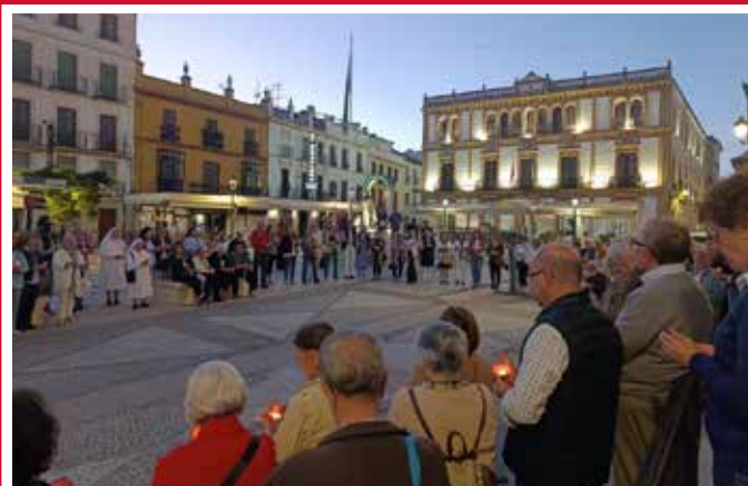
Oración por la paz organizada por el Arc. Ronda-Serranía